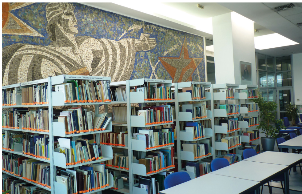
Изглед от представителната част на колекция „Лични библиотеки“ в читалня „Проф. Иванка Апостолова, д.н.“