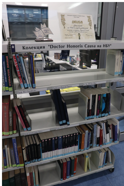
Изглед с част от изданията в колекция „Доктор хонорис кауза“

Колекцията се характеризира с многообразие на включените документи, като това са монографии, сборници, аудиовизуални документи, периодични и нотни издания. Всички документи са подредени на свободен достъп в обособено за целта място в читалня „Проф. Иванка Апостолова, д.н.“. С цел визуализация на принадлежността към специалната колекция, изданията са маркирани със син стикер. До 2017 г. документите, включени в колекцията, се ползват само на място в читалнята, но, поради