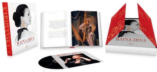
Албумното издание „Raina Diva“