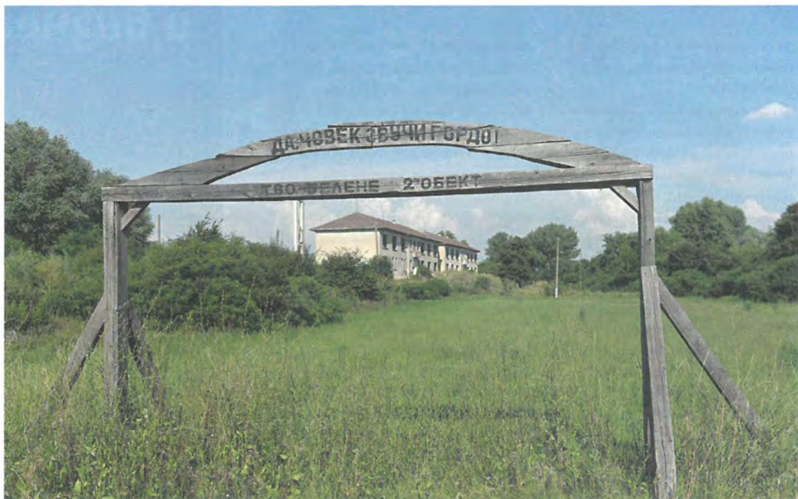
➔ Арката пред концлагера „Белене“ на остров Персин

➔ Занимаването с историята на комунизма и запазването на паметта за неговите престъпления е вид терапия за цялото ни общество.