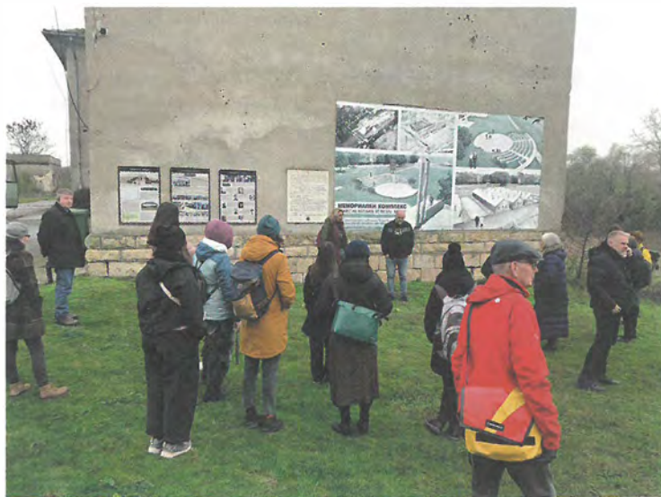
📍 Исторически тур на о. „Белене“