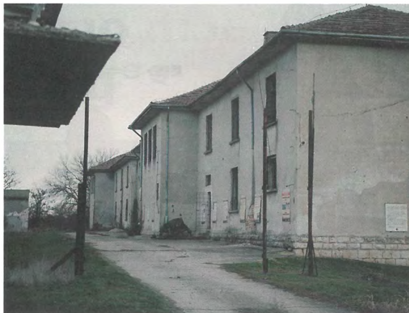
📍 Лозунгът, с който са посрещани новите обитатели на острова е „Врагът престава да е враг, когато е физически унищожен“ |