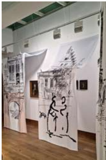
Fig. 1, 1a. UniArt Gallery. Vasil Stoilov: Architectural Motifs , 2024. Exhibition view.

Ил. 1, 1а. Галерия УниАрт . Изложба Васил Стоилов: Архитектурни мотиви , 2024. Експозиционен изглед.