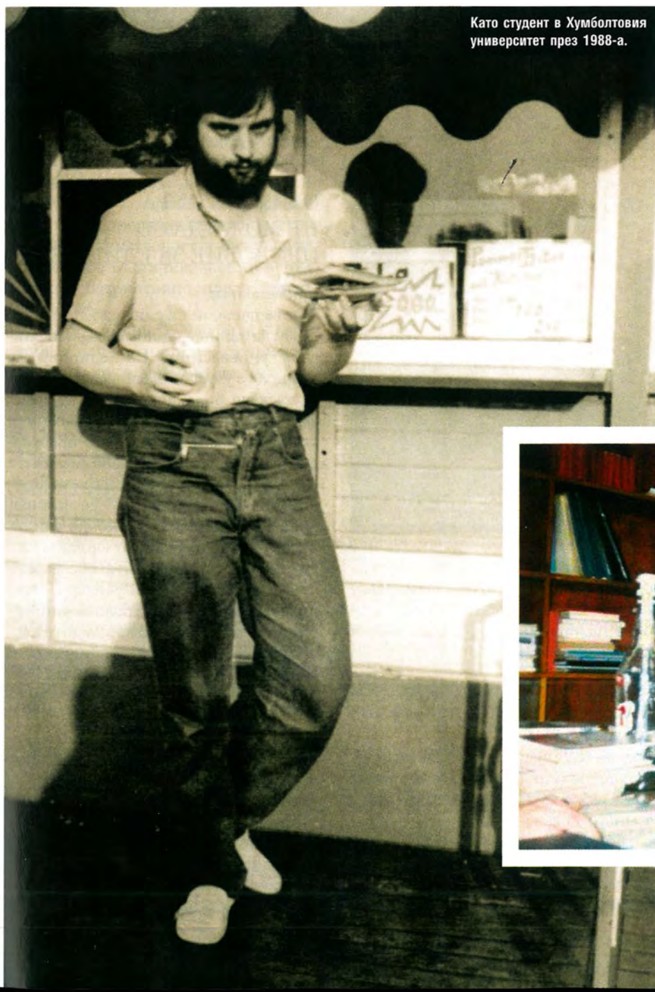
Като студент в Хумболтовия университет през 1988-а.