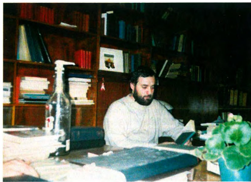
Като млад асистент в библиотеката на катедра Класическа филология през 90-те години.

Присъединил се към компанията на останалите студенти от хуманитарните специалности, с които слушали горе-долу еднакви лекции. Давали го за пример, защото по онова време в Германия нямало гимназии като Класическата у нас. Изпълнителният отличник бил сочен като нагледно доказателство за необходимостта от средно училище, където да се набляга на историята, културата, древните езици. Останал в Германия пет години. В първата учел немски заедно с руски студенти, с които постоянно бърбел на езика на Пушкин и пренебрегвал този на Гьоте. После довършил >>