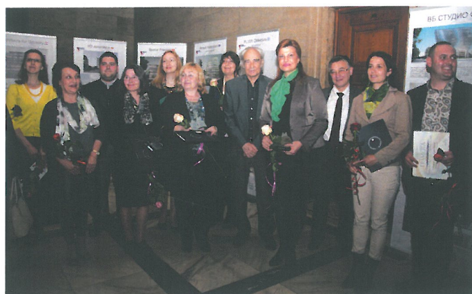
Ключови думи: Годишни награди на ББИА

Мениджърският екип на дружеството се ангажира с обществени и културни каузи, като една от тях е да подкрепя обществени и училищни библиотеки. През 2015 г. дружеството е дарило на регионалната библиотека в Кюстендил над 120 тома литература на обща стойност 3500 лева; подпомогнало е реализирането на няколко премиери на книги; обогатило е чрез дарения на учебна литература фондовете на три училищни библиотеки.