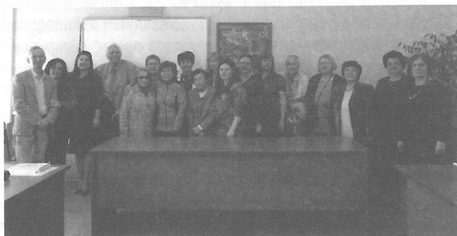
Участниците в кръглата маса.