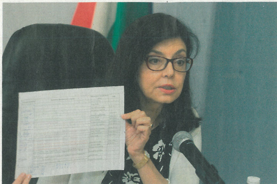
УСПЕХ: В КУРСОВЕТЕ ПО ОГРАМОТЯВАНЕ СА УЧАСТВАЛИ 16 000 НАД 16 ГОДИШНА ВЪЗРАСТ, ПИШЕ В ДОКЛАДА, ИЗГОТВЕН ОТ МОН

По този показател за 2015 г. позицията на България се влошава спрямо тази от 2014 и 2013 г., съответно от 13-а (за 2013) на 15-а (2014) и 16-а позиция през последната 2015 г. Разликата между стойността на дела за България и средната стойност за ЕС намалява непрекъснато през последните 5 години, като за последната година тя е равна на разликата преди 10 години.