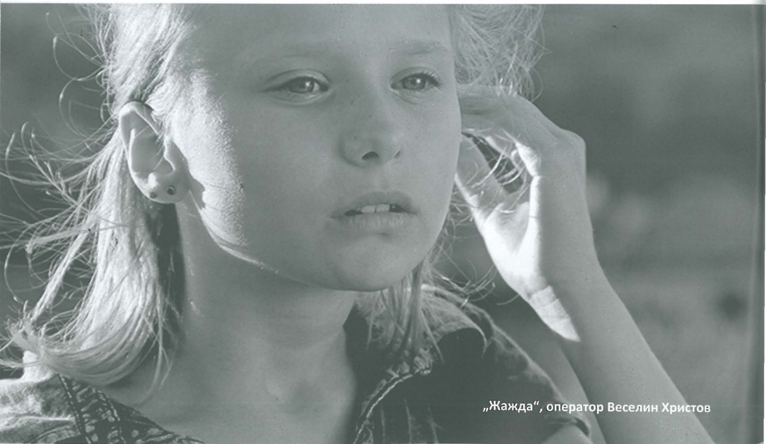
„Жажда“, оператор Веселин Христов

Човекът с кинокамерата е безспорно една от най-важните фигури във филмопроизводствения процес, а този фестивал насочва фокуса към него. Може би все още „Златното око“ събира сили да стане международен форум, но пък с всяко следващо издание се утвърждава като място, което събира новите поколения оператори, тръгнали по стъпките на Бате Димо. ■