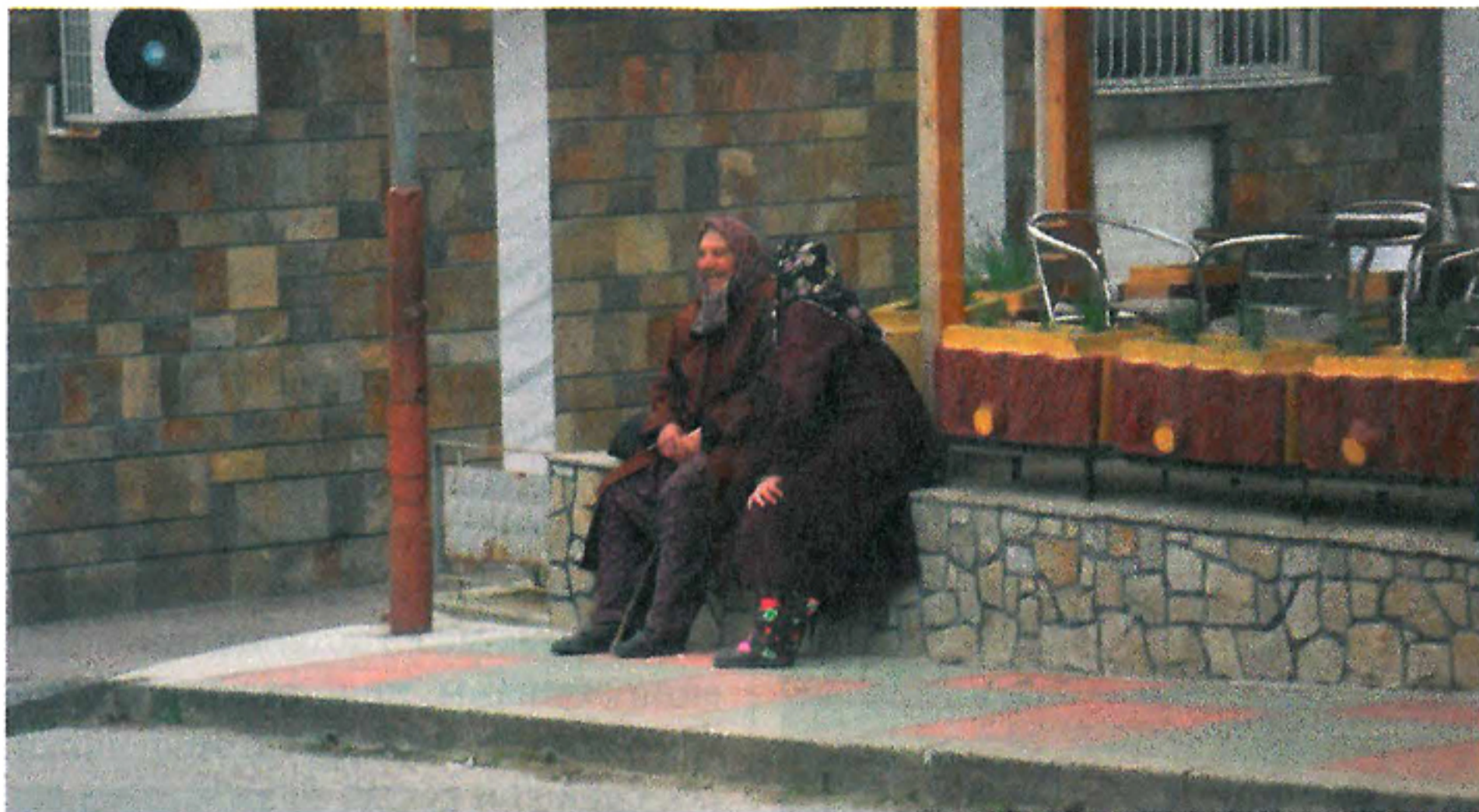
100%: Практически всички бедни в гетата се определят като религиозни

време на Рамазана, са намалели с над 10 пункта и вече са само 30%, както и тези, които ядат свинско – 25%. Висок е делът на правещите доброволни дарения (освен задължителния зекят) – 60%. Сюнетът (обрязването) на момчетата си остава масов – 84%, както и погребенията по предписанията на исляма – 98%.