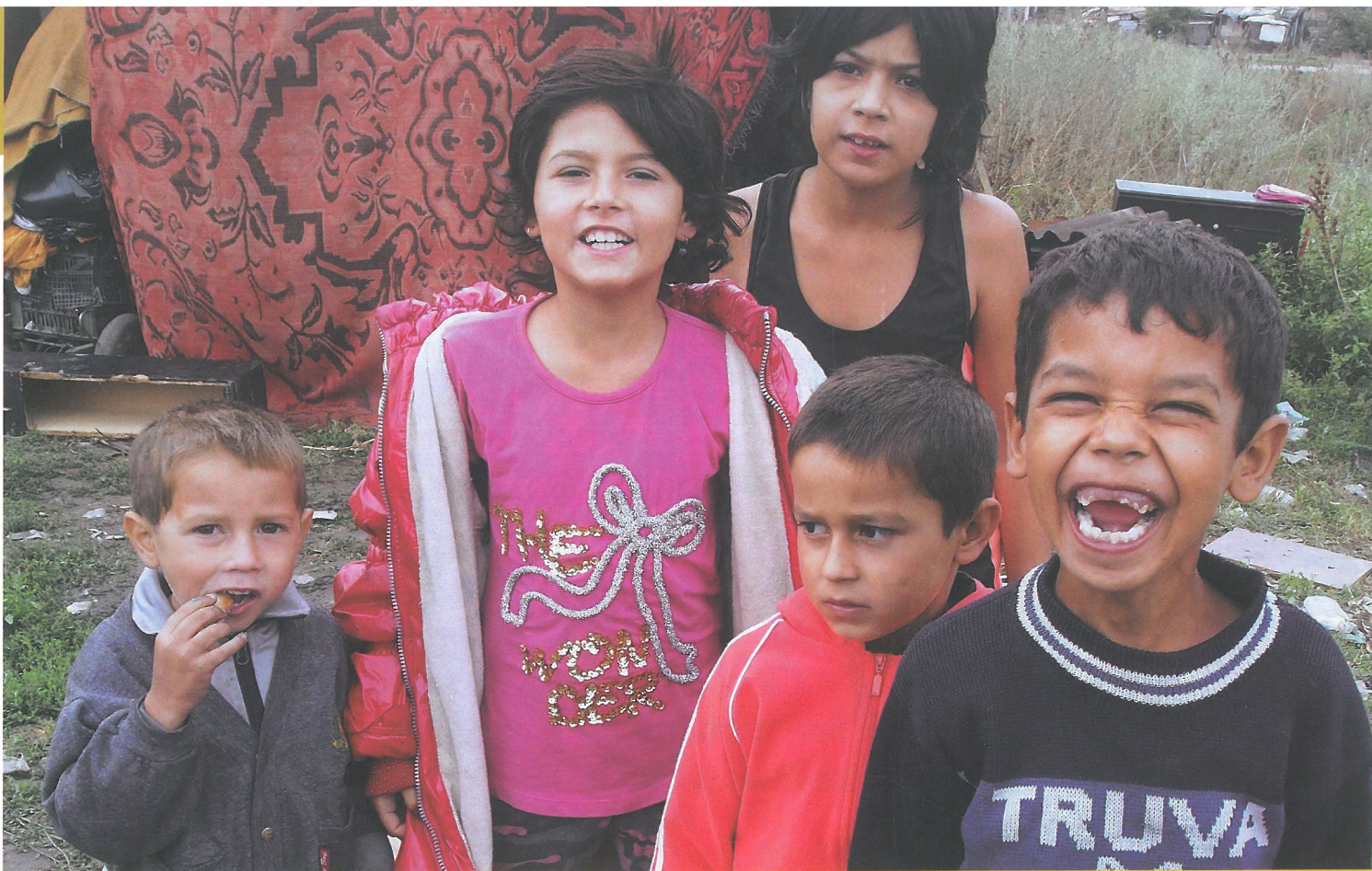
Една четвърт от децата от ромски произход не посещават училище...

училищата из страната посрещат като благодетел – като главен секретар той е одобрявал всички разходи за ремонти, оборудване, транспорт и какво ли не в цялата система.