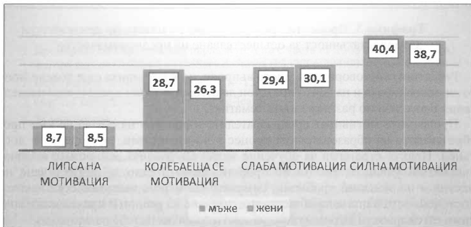
Графика 2. Процентно разпределени на нивата по признак „Мотивация за предприемачество“

Данните за показател Мотивация за предприемачество са представени в графика 2.