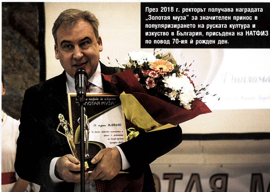
През 2018 г. ректорът получава наградата „Золотая муза“ за значителен принос в популяризирането на руската култура и изкуство в България, присъдена на НАТФИЗ по повод 70-ия ѝ рожден ден.

Що се отнася до театралния факултет, Академията отдавна си е извоювала високо място в световен мащаб – през последните 20 години сме поканени за съчредители и на двете световни асоциации по театрално образование. И почти няма театрален или филмов фестивал, в който наши студенти да участват и да не се върнат с награди. Затова бих казал, че качеството на нашето образование е доказано.”