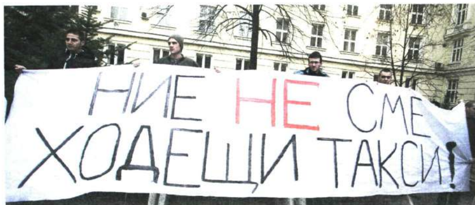
Протест от 2013 г. срещу увеличението на таксите. И днес парите следват студента.

„Българското висше образование не изпълнява мисията си да създава стойностен елит, който да генерира чувство за мисия и дълг“, заключава той, цитирайки Хегел, според когото образованието е изкуството да направим човека етичен.