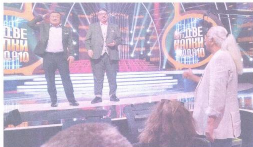
Водещите май са си намерили майстора

- Никое от трите ви деца не тръгна по вашия път, това натъжава ли ви?