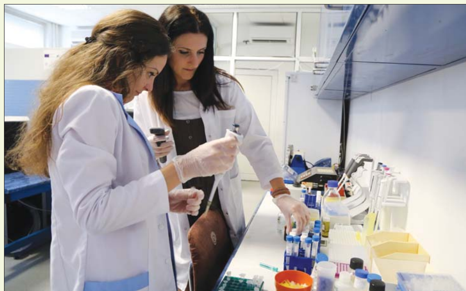
Студентки правят изследвания в Медицинския университет в София.