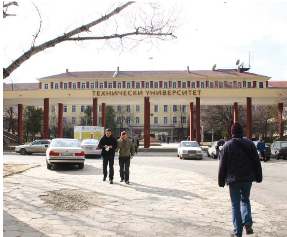
Техническият университет в София предлага промени при балообразуването при приема си.

по един от предметите: химия и опазване на околната среда, математика, физика и астрономия, биология и здравно образование, информатика и информационни технологии, български език и литература - за всички 25 бакалавърски специалности. Матурата по география и икономика важи за специалностите „Индуриален мениджмънт“, „Инженерна екология и опазване на окол-