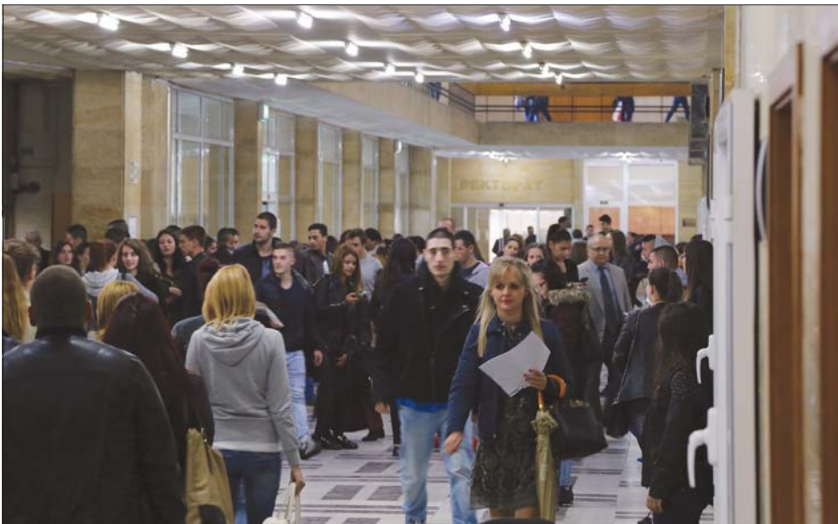
За да кандидатствате в УНСС, трябва да положите единен приемен изпит.

Приетите от първия етап от 13 юли до 15 юли включително имат възможност да се запишат в специалността, в която са класирани, като не участват в следващите етапи; да депозират диплома оригинал за средно образование и да погълнат декларация за участие в следващите етапи на класиране за по-предна желана специалност; да не потвърдят или да не се запишат. В тези случаи те отпадат от всички класирания и губят придобитите студентски права. Незаетите от тях места се погълват на следващото класиране. Класираните по първа желана специалност трябва да се запишат на този етап от класирането, без право на потвърждаване или изчакване края на класирането. Некласираните от този етап кандидати не подават декларация за участие в класирането и не депозират диплома за средно образование, тъй като участват автоматично в следващия етап на класирането.