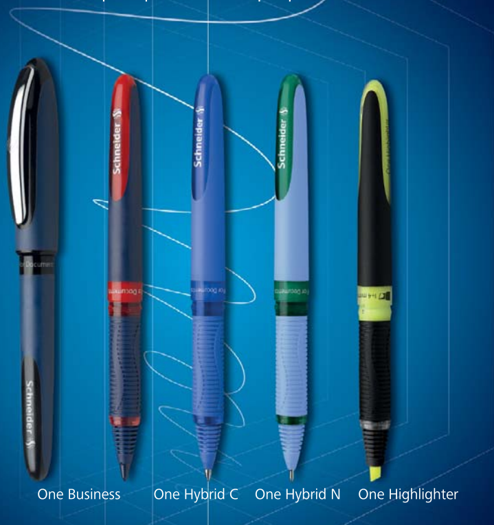
One Business One Hybrid C One Hybrid N One Highlighter