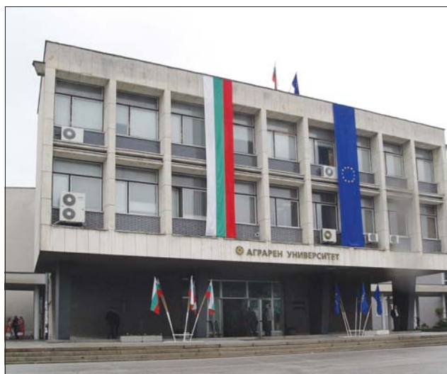
Аграрният университет в Пловдив предлага 20 специалности.

Висшето училище по агробизнес и развитие на регионите в Пловдив също има аграрна насоченост, но с такава са едва 5% от студентите. „Нашето висше училище е единственото, което се приближава до регионите. Обучаваме кадри за пълния сектор на обществените потребности за всяка община“, обясни