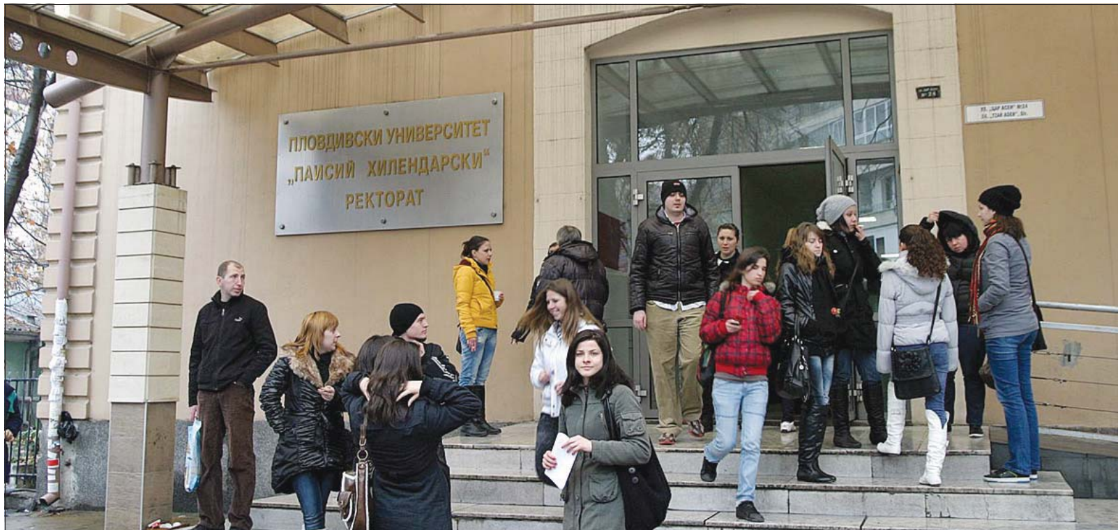
Пловдивският университет „Паисий Хилендарски“ обучава над 20 000 студенти.

Най-висока е безработицата сред завършилите „Животновъдство“