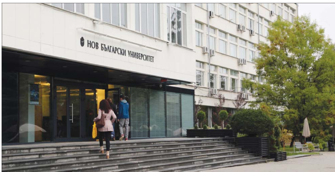
В нито една от програмите на НБУ не може да се влезе само с оценката от матура, традиционно се прави подбор по собствена система.