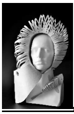
„Все още тук.“

Светът е една огромна мида, а ти си песъчинката, която трябва да се превърне в перла.